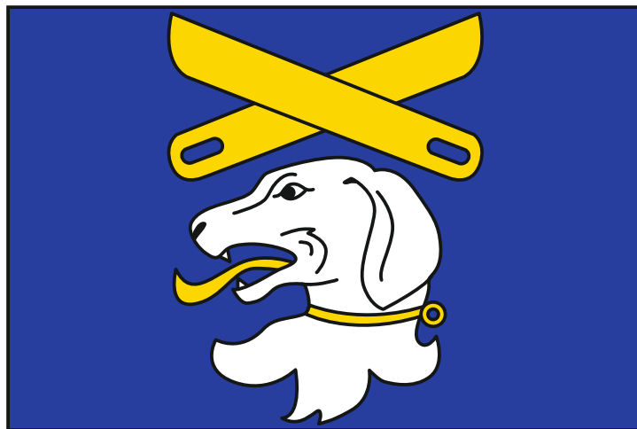
námi podporovaná vlajka

Nebo je možné zvolit tzv. heraldickou vlajku, která zcela opakuje podobu znaku, převedením všech figur ze (svislého) štítu do (vodorovného) tzv. vlajkového listu (obdélníku o stranovém poměru šířky k délce 2:3, daném státní vlajkou ČR). Čili vlajka je v takovém případě celá modrá, nahoře se zkříženými limpami a dole se psí hlavou. Zde je možné zachovat i černé kontury figur (neruší).