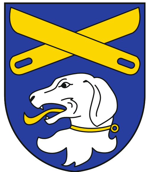
námi podporovaný erb Věžníků s limpami

Zároveň limpy znak obce s psí hlavou (z rodového erbu Věžníků) jasně odlišují a vhodně doplňují, např. i s odkazem na zdejší (relativně mladý) kostel Povýšení sv. Kříže (viz zkřížení dřevěných prkének limp):